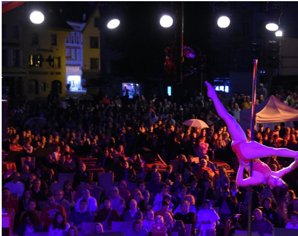
Chant, danse, humour, performances artistiques... 17 talents du Grand Est se sont succédé, dimanche, place de la Réunion. Ici, la magnifique prestation en pole dance.