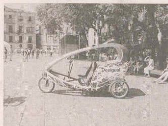
Les vélos-taxis à fière allure et...

Pour en finir avec le trafic automobile, «Mulhouse j'y crois» se demande s'il ne serait pas judicieux de supprimer toute voie de circulation à Porte Jeune. En effet, l'installation du nouveau centre commercial va créer une jonction naturelle entre l'allée piétonne de la rue du Sau-