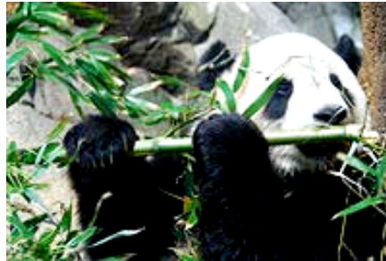
'Tai Shan' au Zoo National de Washington DC.

Le panda géant est depuis longtemps un favori du public , au moins en partie à cause du fait que l'espèce semble ressembler à un ours en peluche vivant. Le fait qu'il est habituellement représenté mangeant paisiblement du bambou, plutôt que chassant, ajoute aussi à son image d'innocence, en effet il passe près de 14 heures par jour à mastiquer du bambou (le bambou constitue 95% de son alimentation).